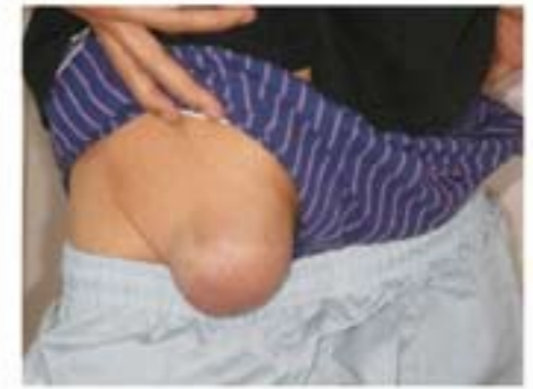
長期に様子をみられていた症例