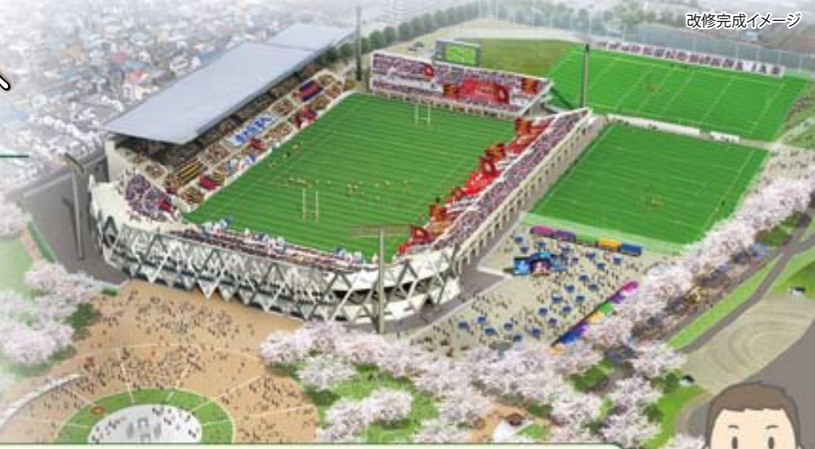
改修完成イメージ