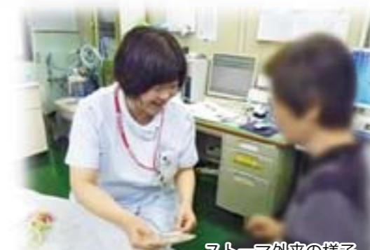
ストーマ外来の様子