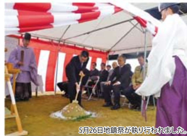
5月26日地鎮祭が執り行われました。

今回は少し「看護小規模多機能型居宅介護」 (略称「かんとき」)の説明をします。 看護小規模多機能型居宅介護とは「通い」「泊 まり」「訪問看護・リハビリ」「ケアプラン」のサー ビスを一体化して、一人ひとりに合わせた柔軟 な支援ができる看護師を中心としたトータルケ アの事業所です。