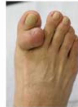
足に発生した症例