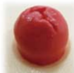
ストーマ (イメージです)