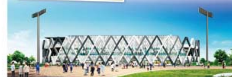
▲新 東大阪市花園ラグビー場完成予想図